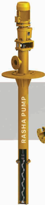
PROGRESSING CAVITY SCREW PUMPS